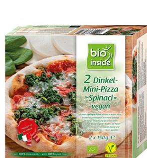
TK DINKEL MINI-PIZZA (2 STÜCK)