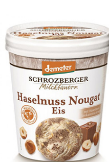
TK HASELNUSS NOUGAT EIS