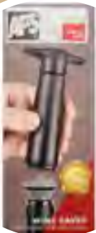
Weinpumpe mit 2 Verschlüssen 22,99 € / Set