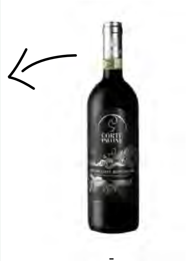
Brunello di Montalcino