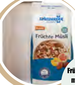
Früchte Müsli Set mit Backblech 5,99 € / 580 g