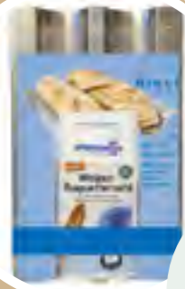
Baguette- mehl-Backset 8,99 € / 1231 g

UNSERE ABVERKAUF-HIGHLIGHTS – SOLANGE DER VORRAT REICHT