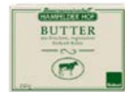
BUTTER, SAUERRAHM HAMFELDER HOF