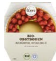
OBSTBODEN AUS RÜHRTEIG