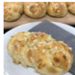
MANDELZOPF (2 STÜCK)