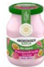
JOGHURT PASSIONS- FRUCHT-GUAVE 3,8%