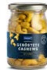
CASHEWS GERÖSTET CURRY IM PFANDGLAS