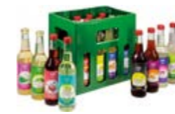
ISIS MISCHKISTE (12 FLASCHEN)