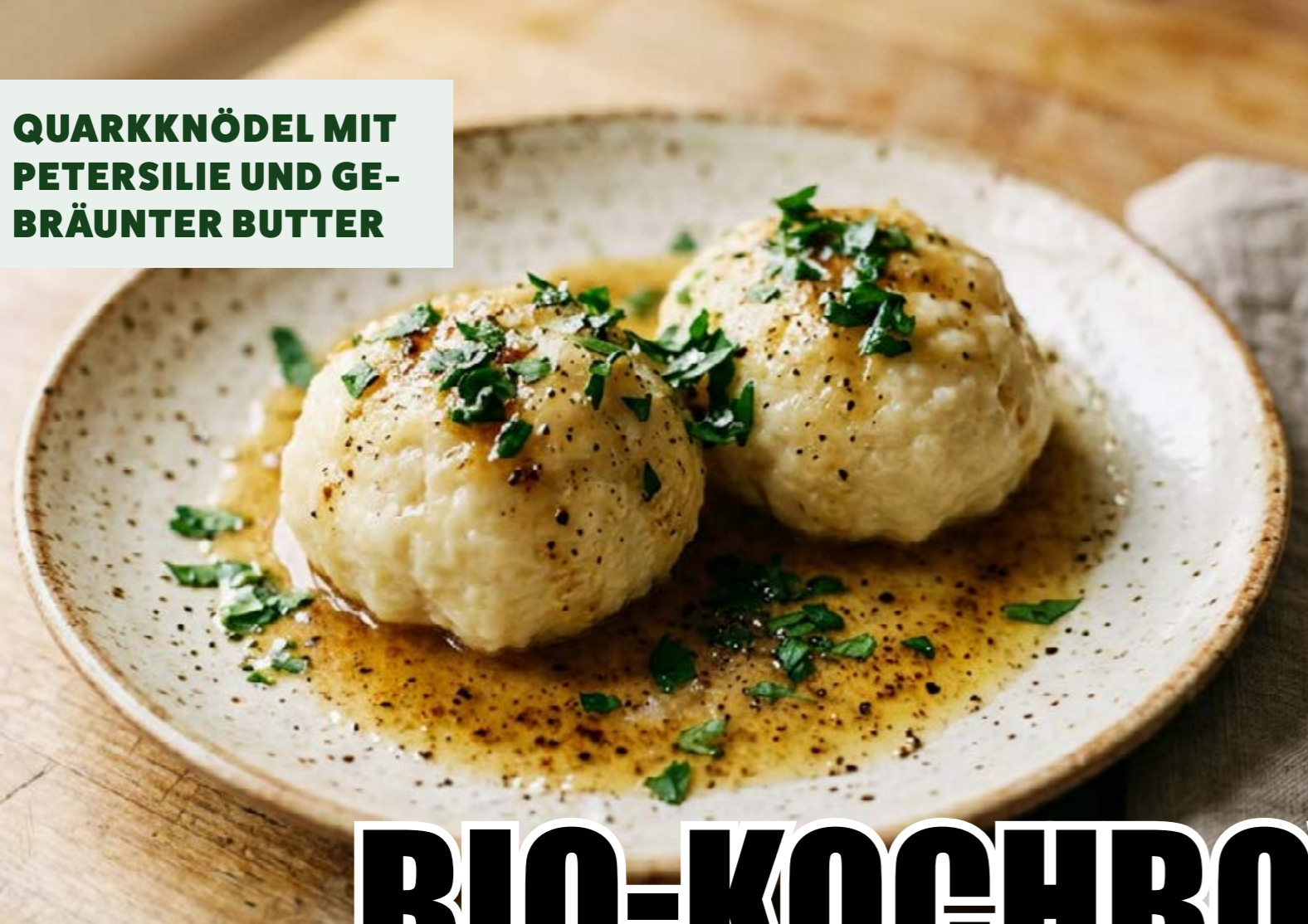
QUARKKNÖDEL MIT PETERSILIE UND GE- BRÄUNTER BUTTER