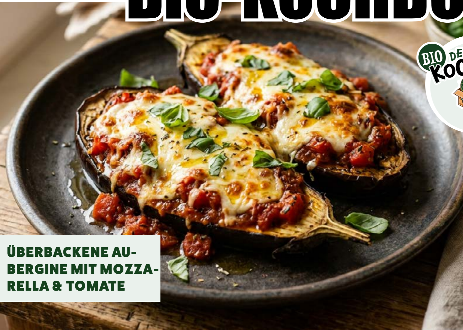
ÜBERBACKENE AU- BERGINE MIT MOZZA- RELLA & TOMATE