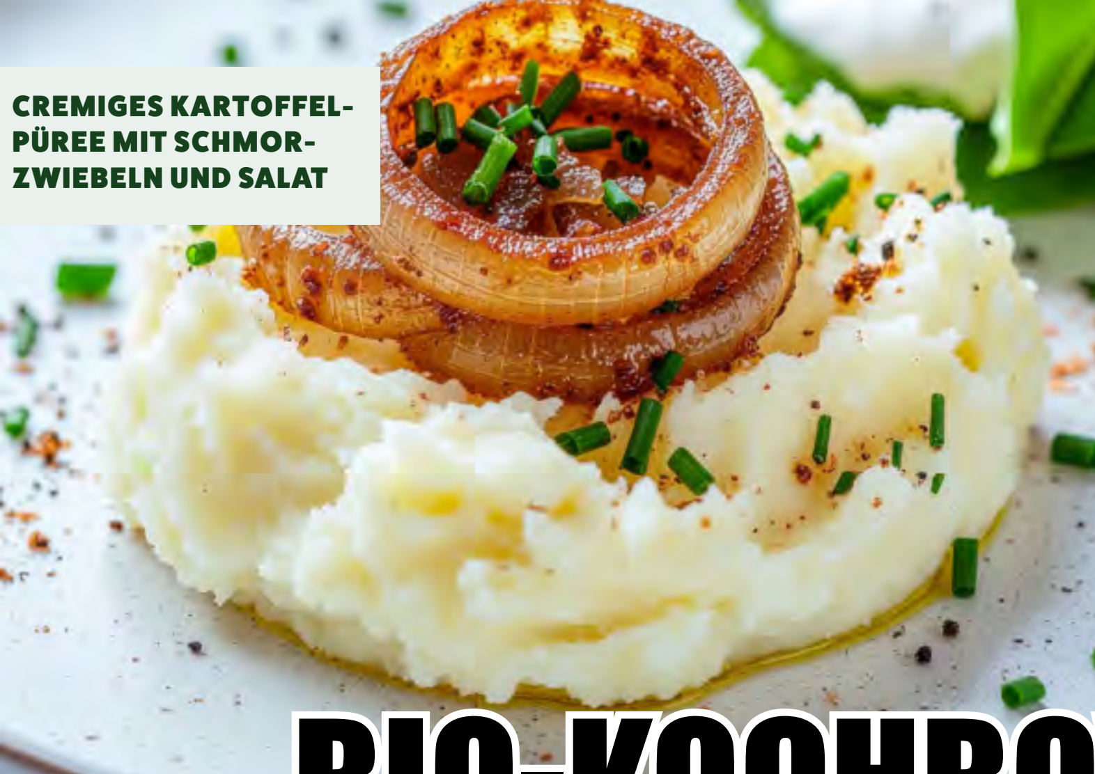
CREMIGES KARTOFFEL- PÜREE MIT SCHMOR- ZWIEBELN UND SALAT