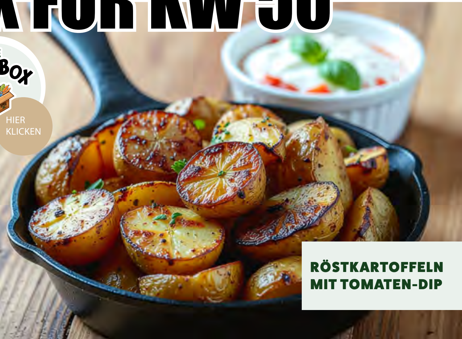
RÖSTKARTOFFELN MIT TOMATEN-DIP