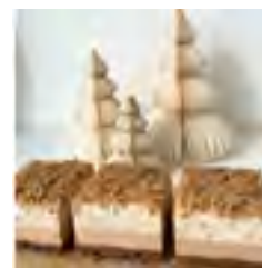
LEBKUCHEN-SAHNE (2 STÜCK)