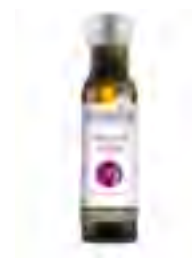
OLIVENÖL UND TRÜFFEL