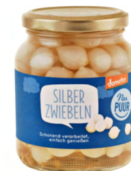
SILBERZWIEBELN SÜSS- SAUER