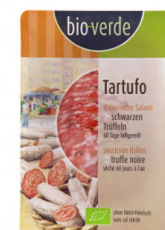
TARTUFO SALAMI MIT TRÜFFEL