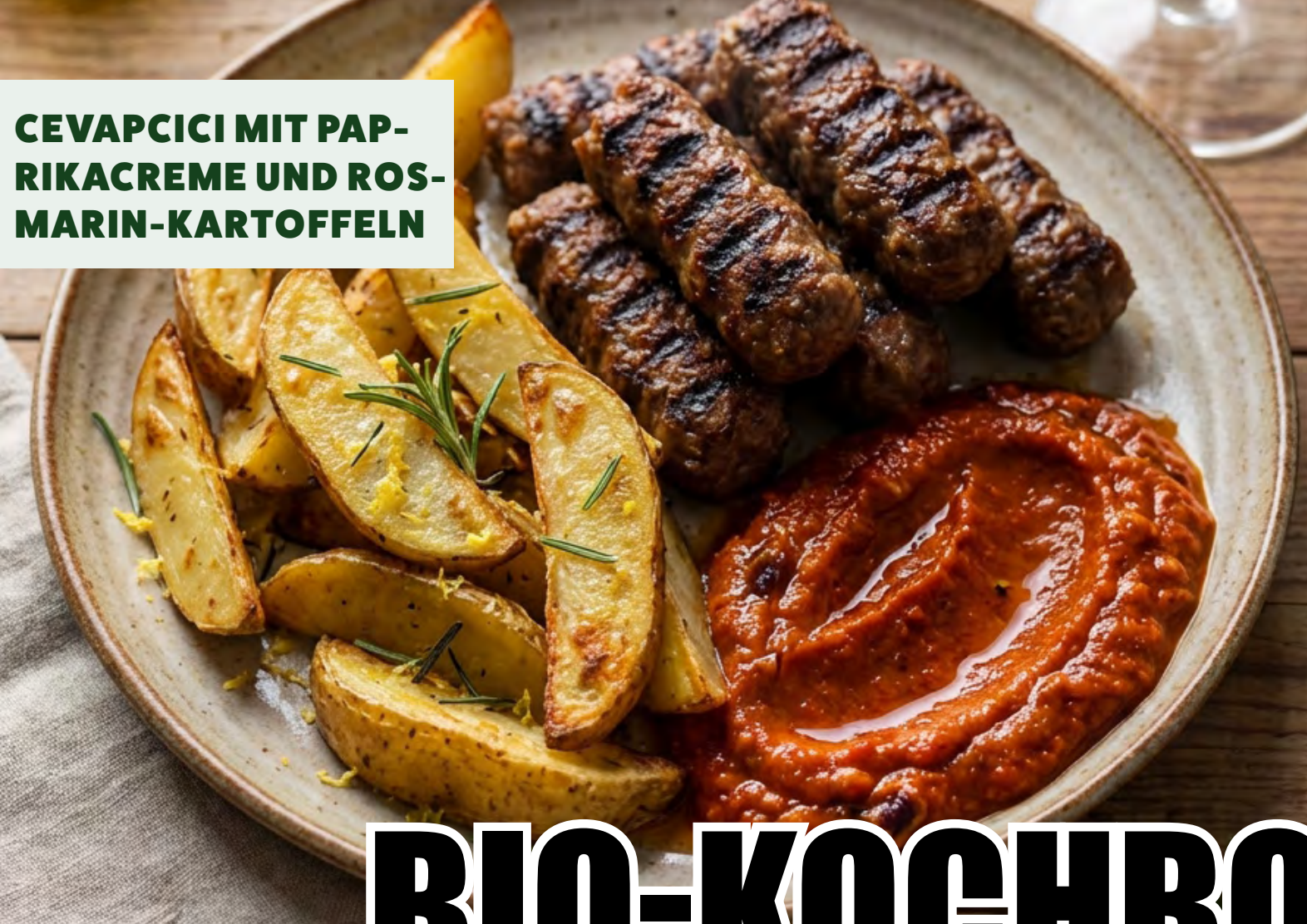
CEVAPCICI MIT PAP- RIKACREME UND ROS- MARIN-KARTOFFELN