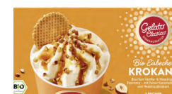
TK KROKANT HASELNUSS EIS