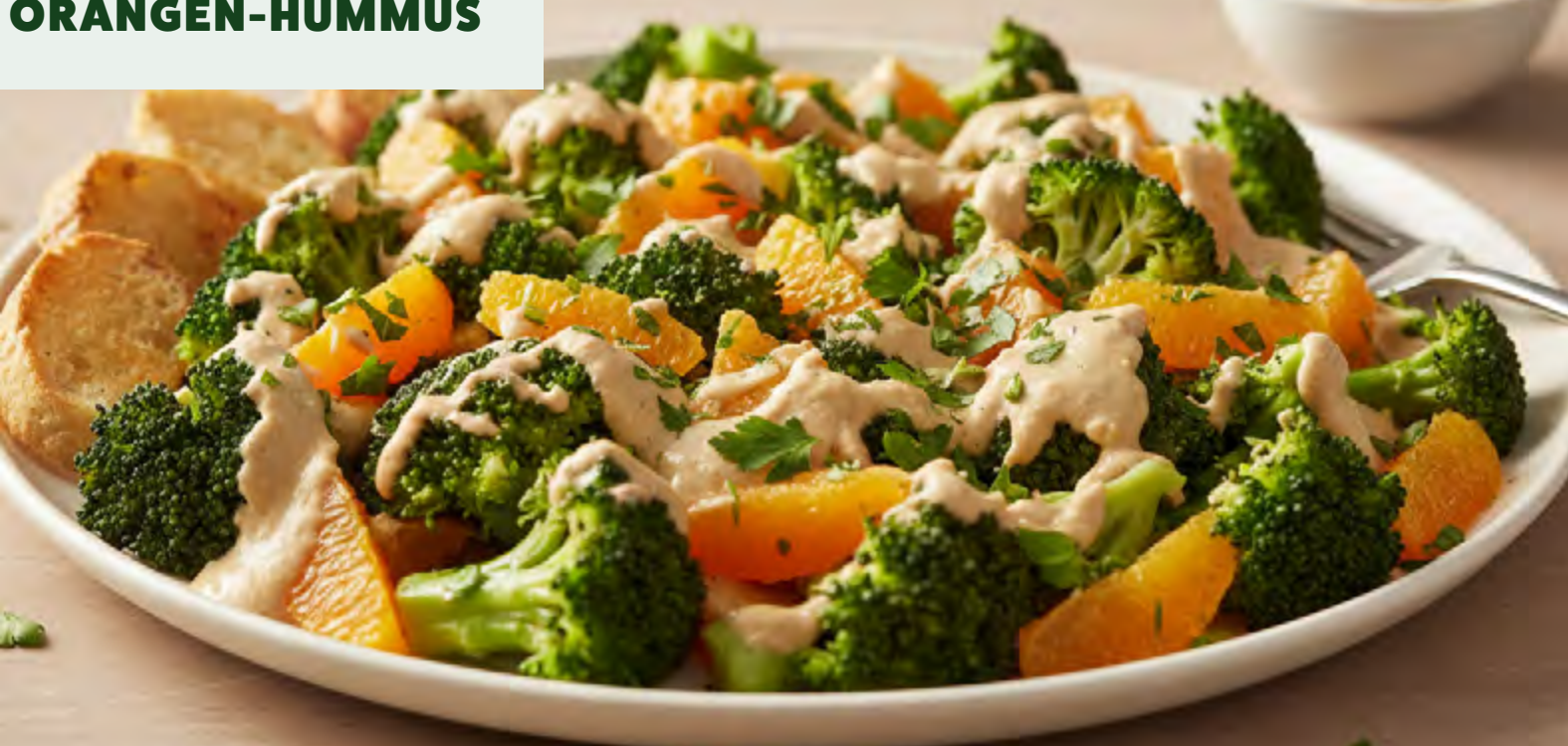
BROKKOLI-SALAT MIT ORANGEN-HUMMUS